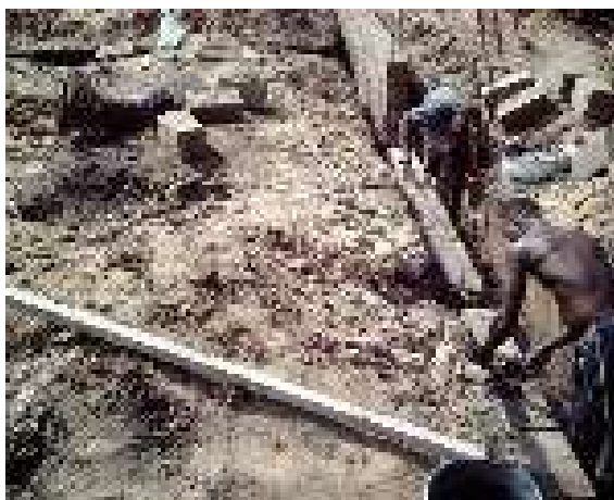
L'élévation des murs de l'école de Bolou en juillet 2005