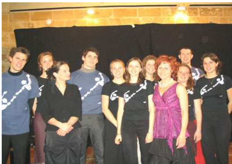
Les membres de Déka-Ewé France autour des deux musiciennes