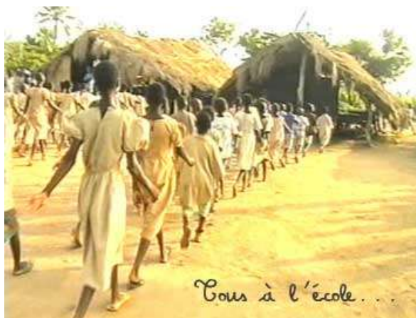
L'école actuelle de Bolou

En plus de répondre à un besoin, il est important que la demande émane de la population locale. Il ne s'agit pas de pointer une zone géographique, de rechercher les statistiques et de se dire que ce village aurait besoin d'aide. Le fait que les populations locales soient à l'origine du projet ou en aient fait la demande garantit sa pérennité (nous reviendrons sur ce thème plus tard). Si le projet répond à leurs attentes, elles sauront comment utiliser et gérer ce nouvel outil et s'attacheront à le préserver. Ainsi, notre projet « Une école pour Bolou » est né de la demande des instituteurs du village, en concertation avec le comité des parents d'élèves, le comité de développement et le chef du village. Depuis le début du projet, tous sont impliqués dans sa réalisation, ils participent directement à la main d'œuvre pour la construction. Tout ceci nous porte à penser qu'une fois les travaux finis, ils pourront réellement bénéficier de cette infrastructure et s'attacheront à la préserver.